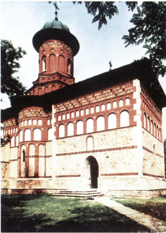
Biserica Sfântul Nicolae din Dorohoi