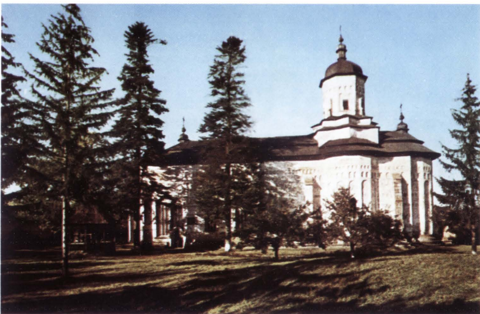
Biserica mănăstirii Probota