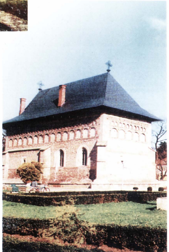
Biserica Nașterea Sfântului Ioan Botezătorul din Piatra-Neamț