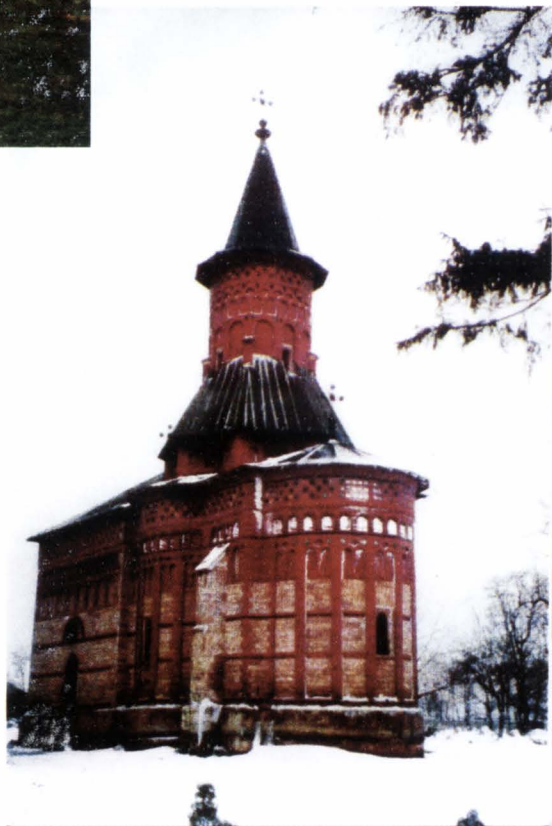
Biserica Sfântul Nicolae-Popăuți din Botoșani