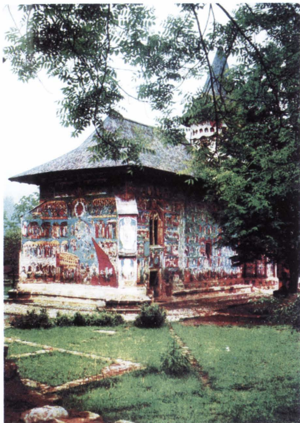
Biserica Sfânta Cruce din Pătrăuți