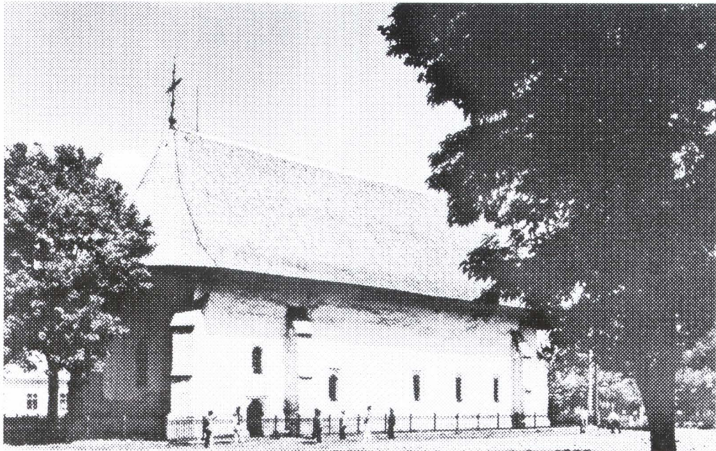
Biserica Sfântul Nicolae din Rădăuți